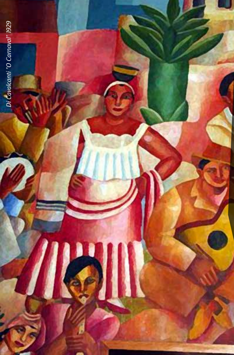
Di Cavalcanti "O Carnaval" 1929