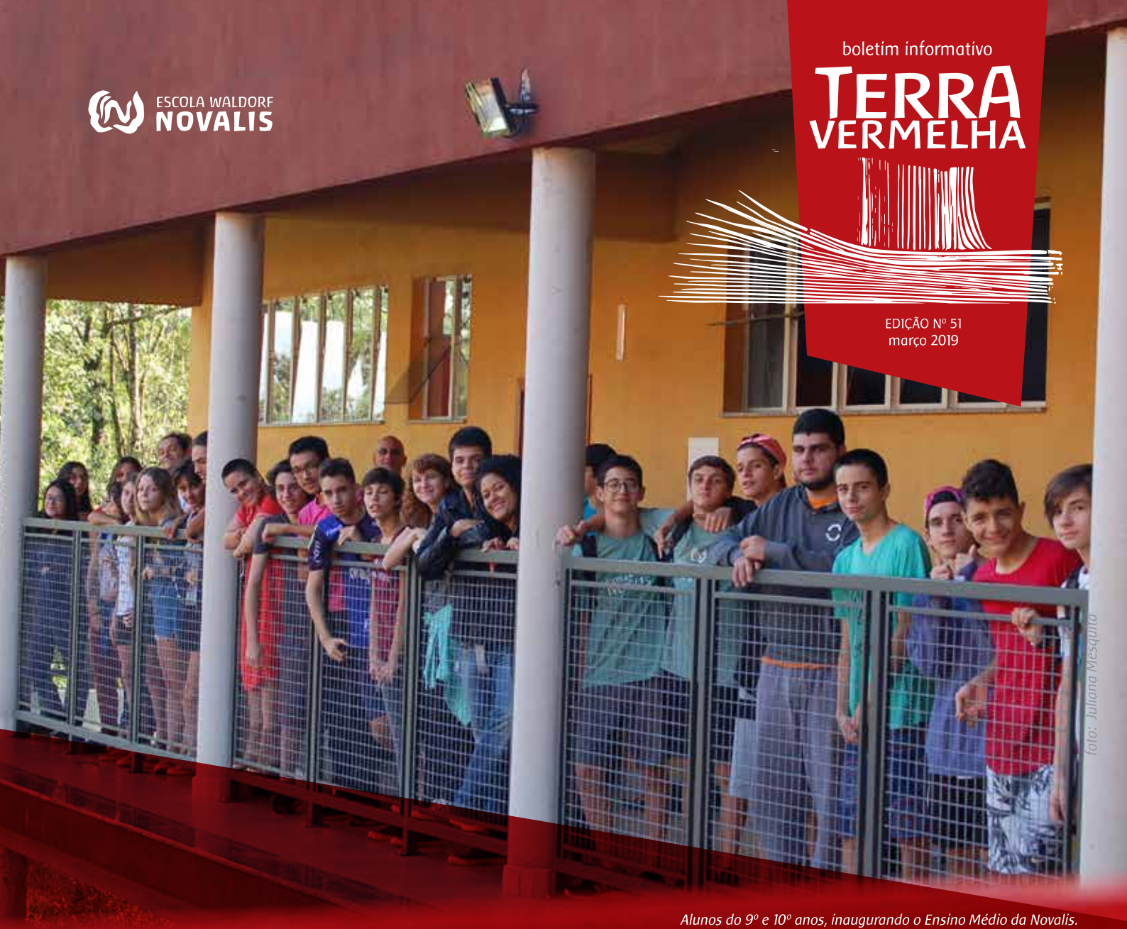
Alunos do 9º e 10º anos, inaugurando o Ensino Médio da Novalis.