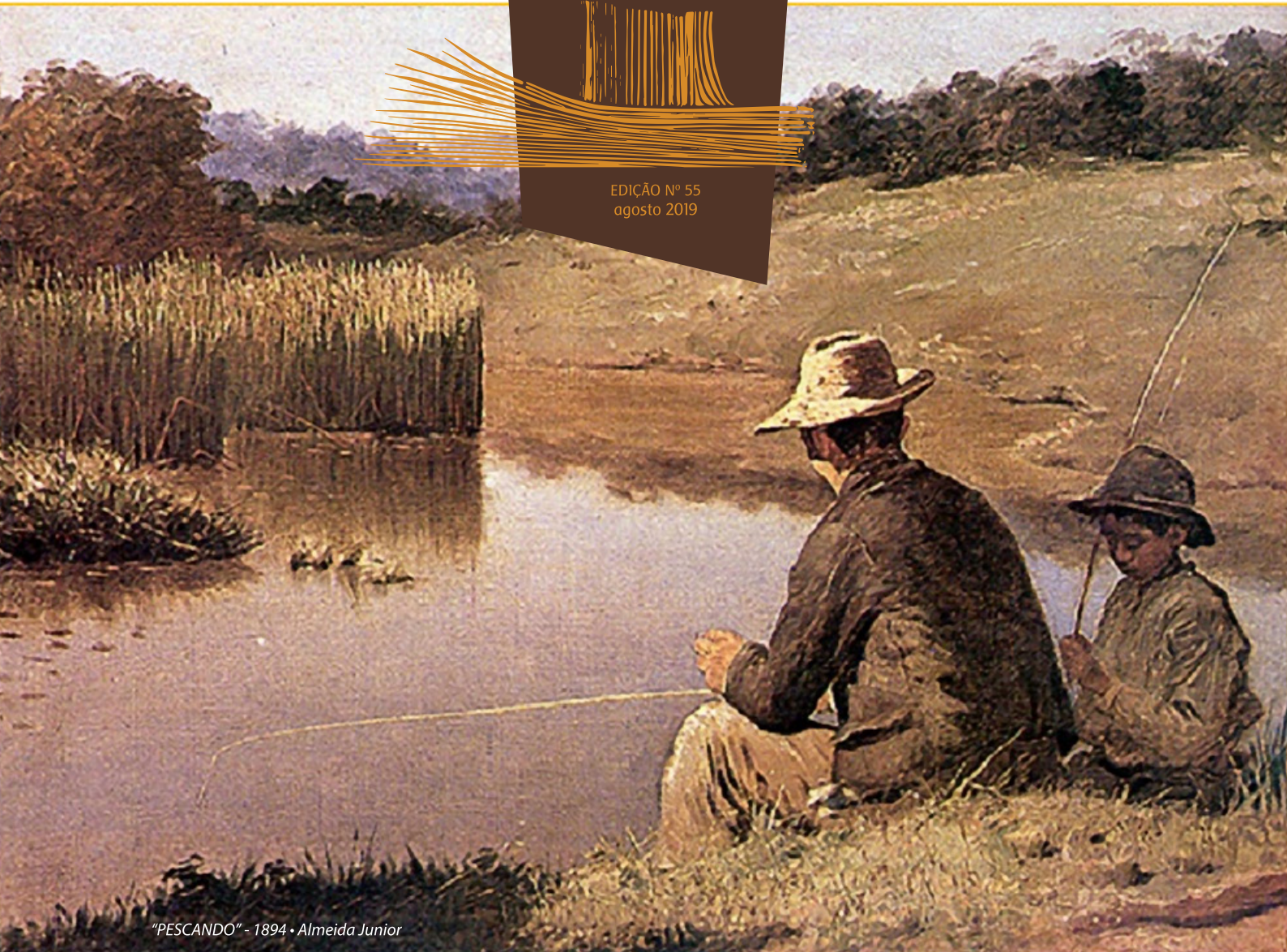
"PESCANDO" - 1894 • Almeida Junior